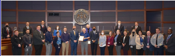
Abril como Mes de Prevención del Abuso Infantil