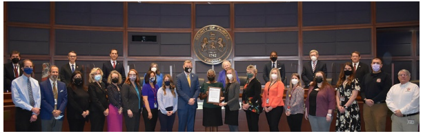
4-10 de abril como Semana de la Salud Pública